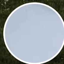
Magestic Beläggning med zinkmagnesium. OBS! Levande material som åldras med sin omgivning.