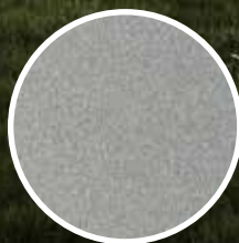
045 Silver metallic